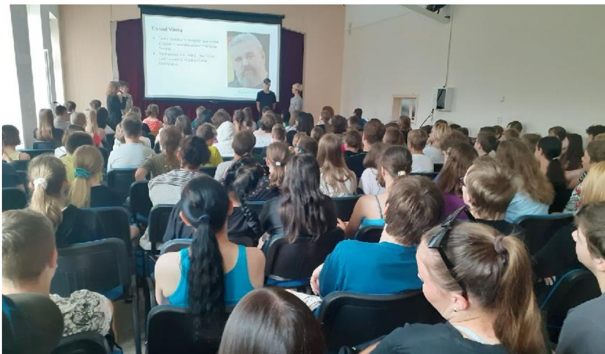
Prezentace absolventských prací

Absolventské práce žáků 9. ročníku - 21. 6. 2023 prezentovali ve Spolkovém domě žáci 9. ročníku své absolventské práce. Svým mladším spolužákům 2. stupně ZŠ předvedli, jak dokáží společně zpracovat vybraná témata, provést jednoduchý výzkum včetně jeho grafického ztvárnění a to vše vhodnou formou prezentovat před veřejností. Žáci prezentovali práce s názvy: Instituce Elán, Auta 90. let, Rio de Janeiro, Středověká zbroj, Opera v Sydney, Fobie, Historie herní série Mafia, Kostel všech svatých, Cukry, Eiffelova věž, Operace Anthropoid, Lednicko - valtický areál. Účastníci prezentací se tak dozvěděli plno zajímavých informací.