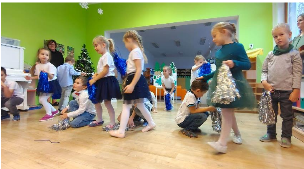
Vánoční besídka dětí