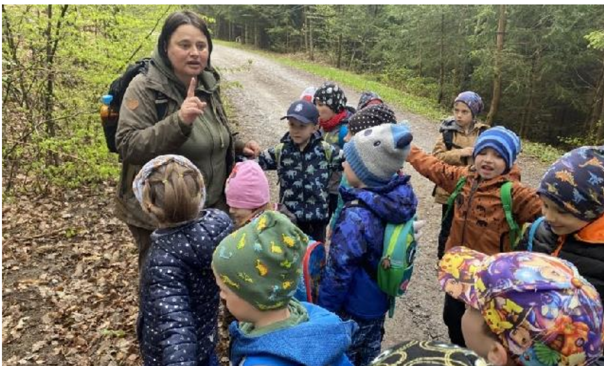
Jaro v lese