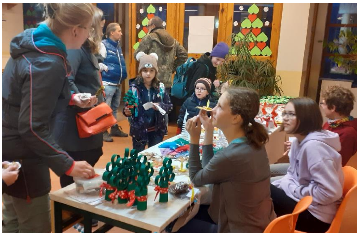
Den otevřených dveří školy