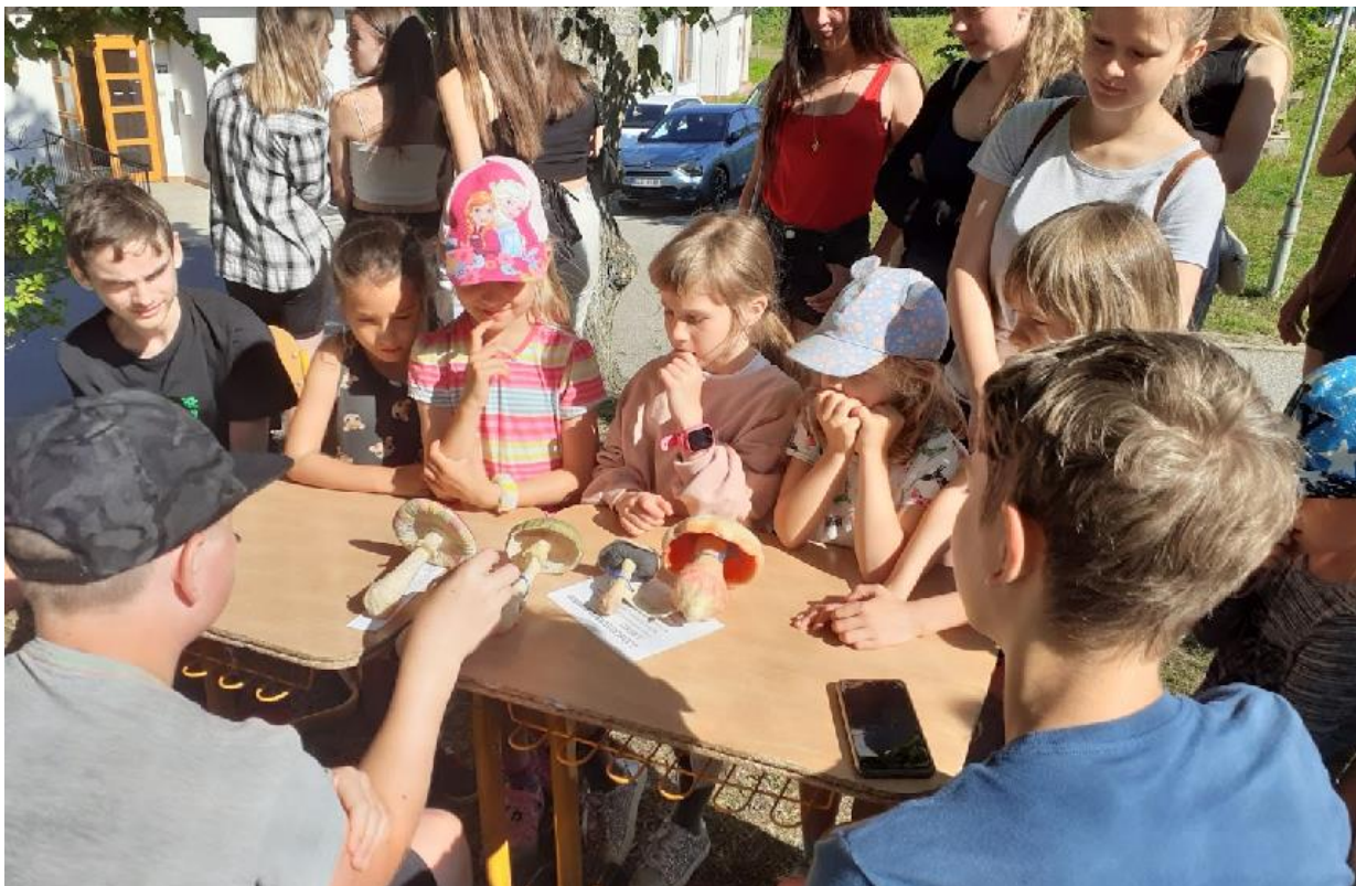
Den prevence a předlékařské první pomoci