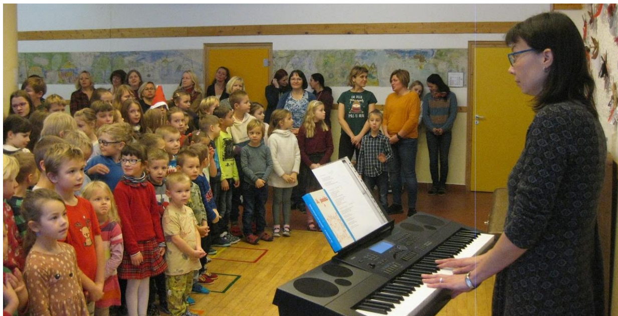
Společné zpívání koled

21. 12. 2022 - společné zpívání koled dětí, žáků a zaměstnanců v prostoru parket 1. stupně ZŠ