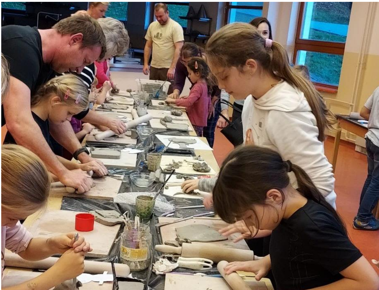
Předvánoční keramické dílničky

9. 11. 2022 – exkurze žáků 9. B třídy do studia České televize Brno