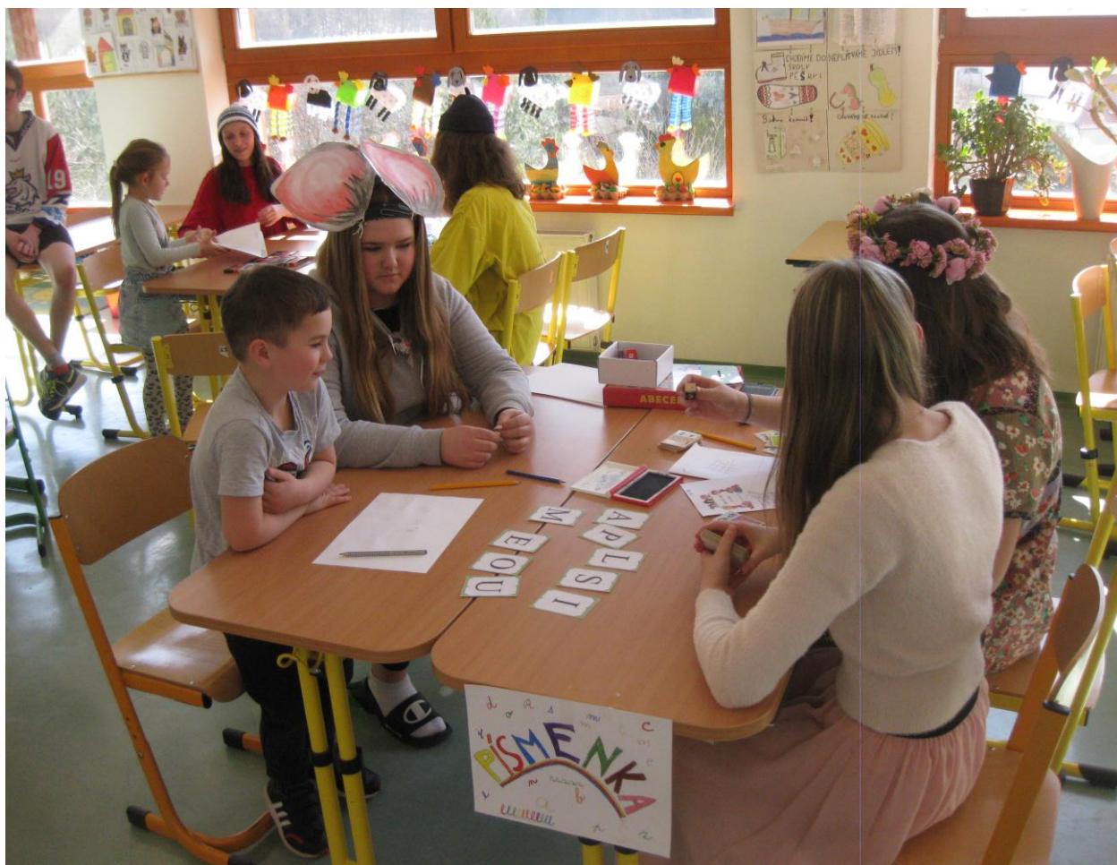
Zápis dětí do 1. třídy