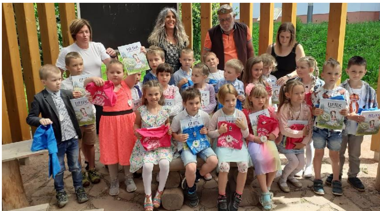
Pasování na školáky

12. 6. 2023 – pasování na školáky, venkovní učebna