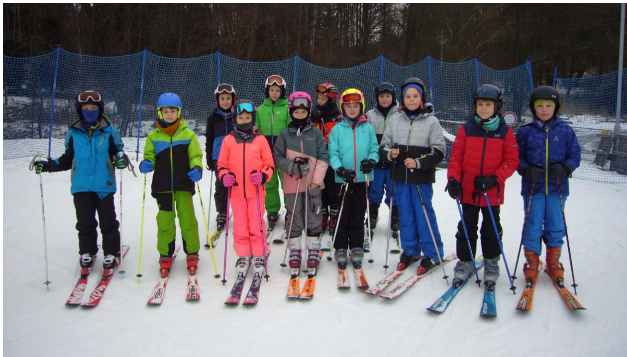
Lyžařský výcvikový kurz

24. 1. – 27. 1. 2023 se konal LVK v Hodoníně u Kunštátu pro žáky 1. stupně ZŠ