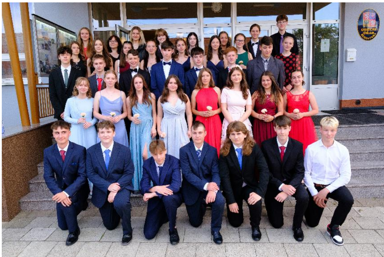
Absolventi školy 2022/23

23. 6. 2023 – Absolventský večer žáků 9. A a 9. B třídy v prostorách společenského sálu v Bukovince