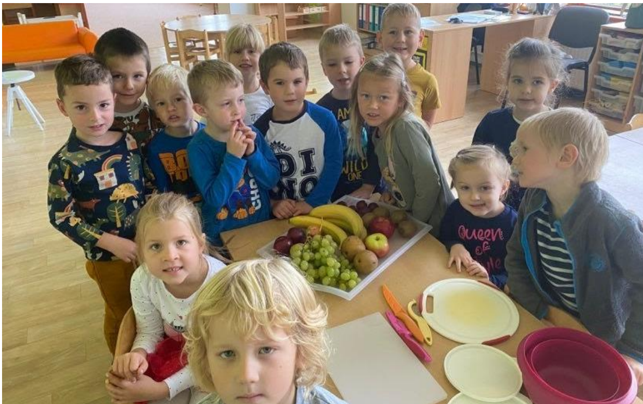
Den zdravého životního stylu